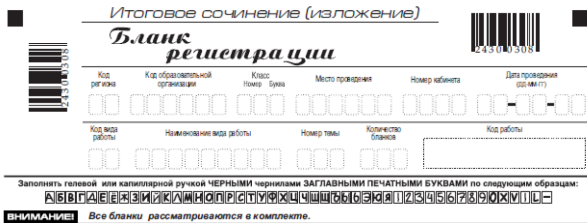
Рис. 2. Верхняя часть бланка регистрации

В верхней части бланка регистрации (рис. 2) расположены: вертикальный и горизонтальный штрих-коды; поля для рукописного занесения информации; строка с образцами написания символов; Поле «код работы» формируется автоматизированно при печати бланков.