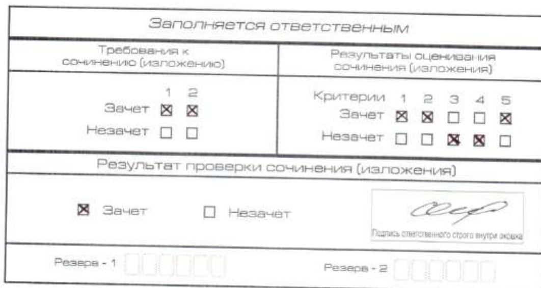
Рис. 6. Область для оценки работы

После окончания заполнения бланка регистрации ответственное лицо ставит свою подпись в специально отведенном для этого поле.